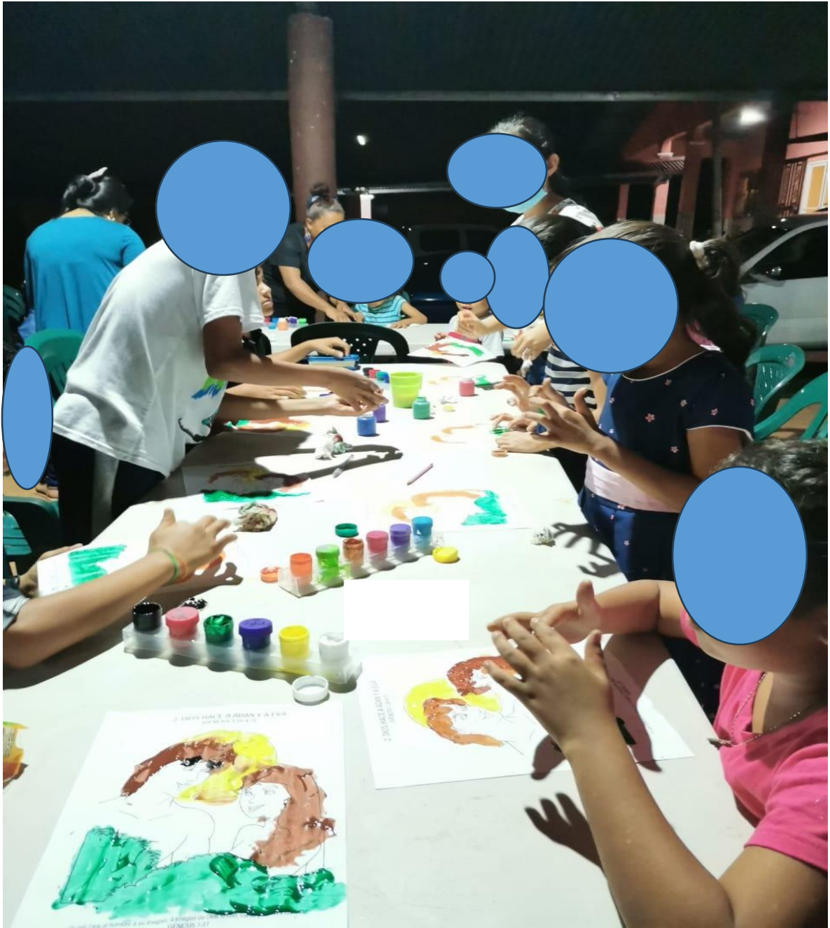
Aplicación de Técnica de integración grupal.