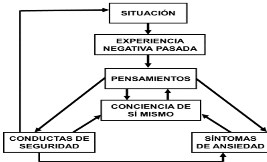
Figura 1. Intervención Cognitiva conductual.

Fuente: Beidel, Alfano, Kofler, y Rao, 2014