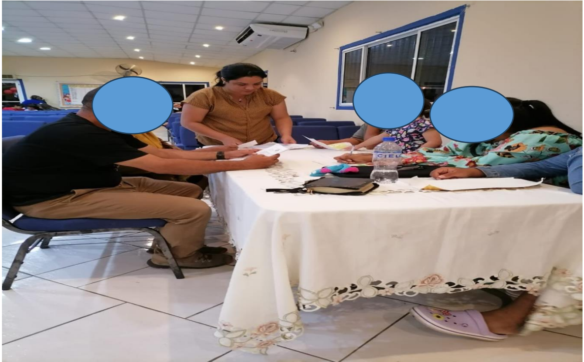
Trabajando con los padres de familia de los niños a quienes se les aplicó la terapia cognitiva conductual.