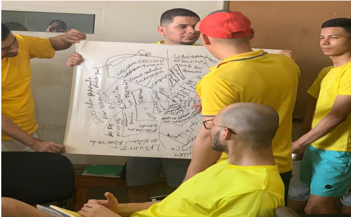
Imagen 2. Trabajo colaborativo.