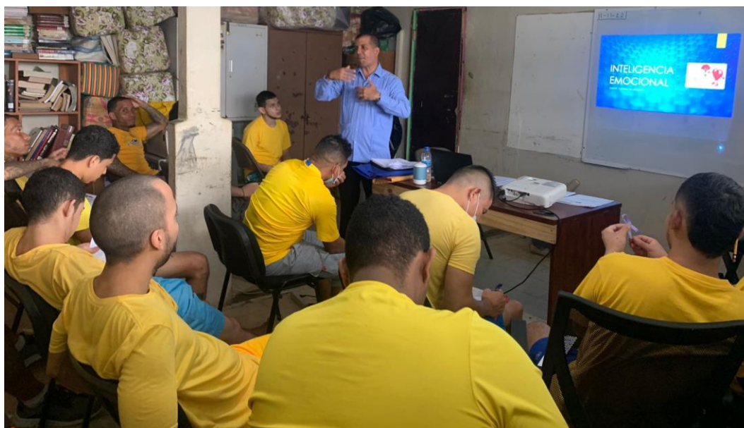
Cuadro 4. Taller 2: Comunicación Familiar.