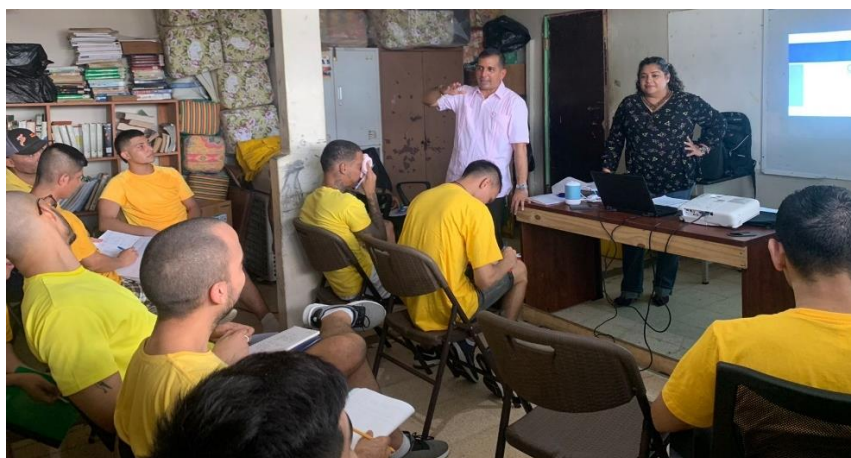
Cuadro 5. Taller 3: Gestión Emprendedora.