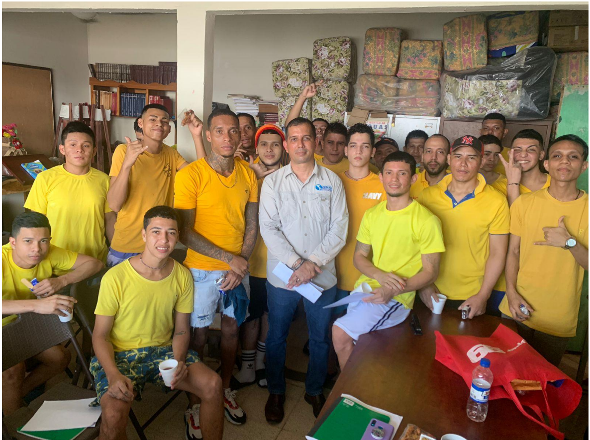
Imagen 1. Participantes del programa.