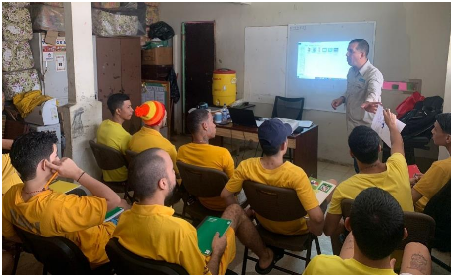
Imagen 3. Beneficiarios del programa.

El programa está dirigido a privados de libertad quienes tienen condenas en ejecución y atendiendo literalmente al artículo 58 del Código Penal de Panamá...que versa sobre el derecho al beneficio educativo y el cumplimiento de la tercera parte de la condena.