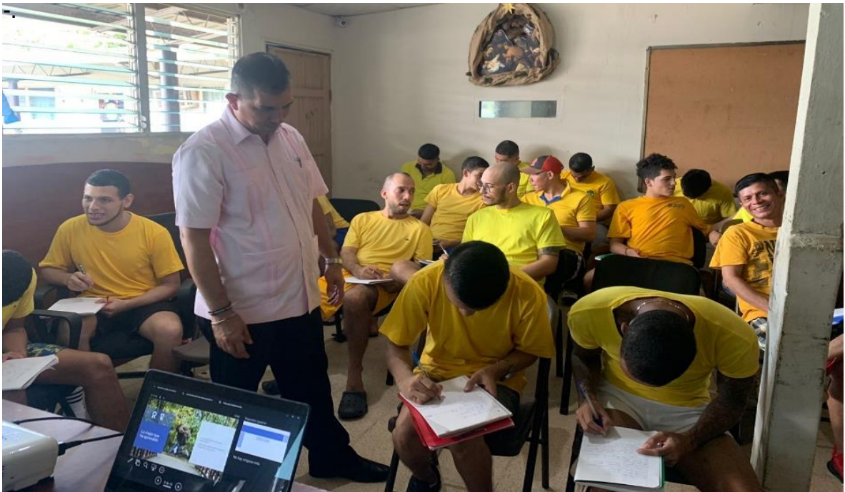
Imagen 4. Evaluación Diagnóstica.