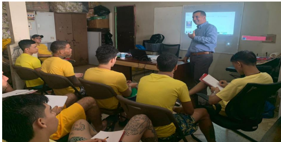
Imagen 9. Taller Gestión Emprendedora.